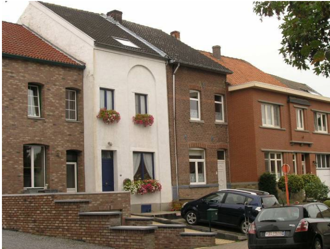
Huidige toestand op het Deunsje