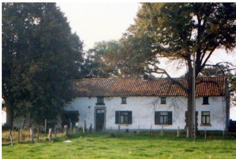
Huis Lemme in Bolder